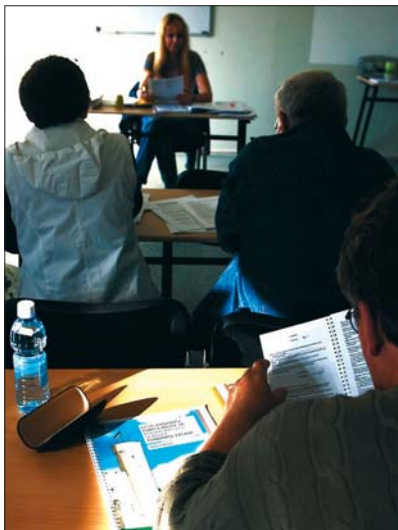
Kursus kodakondsuse taotlejatele

Kodakondsuse taotlejatel, kes sooritavad nii keeleeksami kui ka seaduste tundmise eksami, on õigus taotleda eksamikeskuselt ühekordset hüvitist eesti keele õppele kulunud õppemaksu eest. Taotlus tuleb esitada kolme kuu jooksul pärast viimase eksami sooritamist.