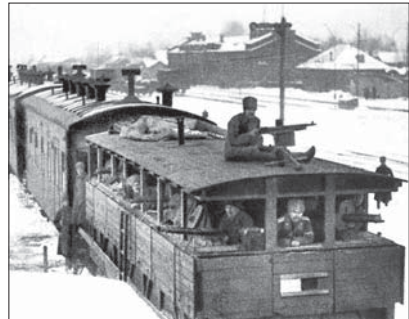
Soomusrong Vabadussõja päevil

Vabadussõjas (1918–1920) võitles Eesti sõjavägi nii Punaarmee kui ka Läti territooriumil tegutsevate saksa väekoondiste – Rauddiviisi ja kohalikest baltisakslastest moodustatud Landeswehr 'iga. Eesti sõjaväe ülemjuhataja Vabadussõjas oli kindral Johan Laidoner. Eestit toetasid Briti laevastik ning Soome, Taani ja Rootsi vabatahtlikud. Eesti ülemjuhatause all võitlesid eestlaste kõrval ka baltisakslaste, venelaste, lätlaste ja ingerlaste rahvuslikud pataljonid. 1919. aasta kevadeks tõrjuti Punaarmee Eesti pinnalt välja. Seejärel peeti positsioonisõda Narva rindel ja Kagu-Eestis.