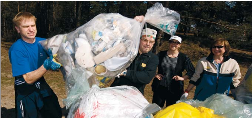
Koristuspäev „Teeme ära 2008”

Osalusveebis www.osale.ee on igal inimesel võimalik esitada valitsusele ettepanekuid, koguda allkirju kodanikualgatuse toetuseks, avaldada arvamust valitsuse eelnõude kohta.