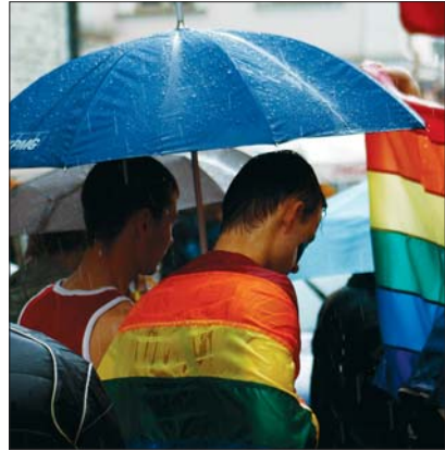
Eestis on igaühel õigus tutvustada oma vaateid

tutvustada sõnas, pildis või muul viisil. Mõtted võib kirja panna raamatusse või kirjutada artikli, kommenteerida võib ka teiste väljaütlemisi internetis. Seda tehes tuleb silmas pidada teiste inimeste õigusi ja vabadusi ning hoida avalikku korda. Riigil on kohustus tagada igaühe õiguste ja vabaduste kaitse, tõrjuda rassilist või poliitilist vihkamist.