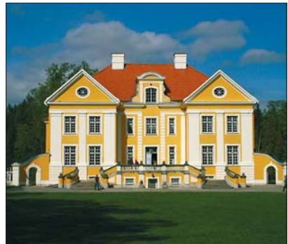
Palmse mõis – üks kaunimaid mõisahooned Eestis