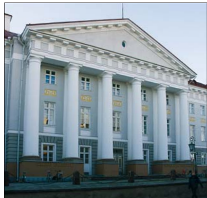
Tartu Ülikooli peahoone

Pärast gümnaasiumi on võimalik edasi õppida ülikoolis , rakendus- või kutsekoolis. Tuntuim Eestis tegutsev ülikool on Tartu Ülikool, mis asutati juba 1632. aastal.