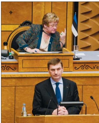
Riigikogu esimees Ene Ergma ja peaminister Andrus Ansip Riigikogu saalis

Riigikogu nimetab ametisse mitme institutsiooni juhid. Riigikogu nimetab presidendi ettepanekul ametisse näiteks Riigikohtu esimehe, Eesti Panga nõukogu esimehe, riigikontrolöri, õiguskantsleri ja kaitseväge juhataja. Riigikohtu esimehe ettepanekul nimetab Riigikogu ametisse Riigikohtu liikmed. Samuti nimetab Riigikogu Eesti Panga nõukogu liikmed.