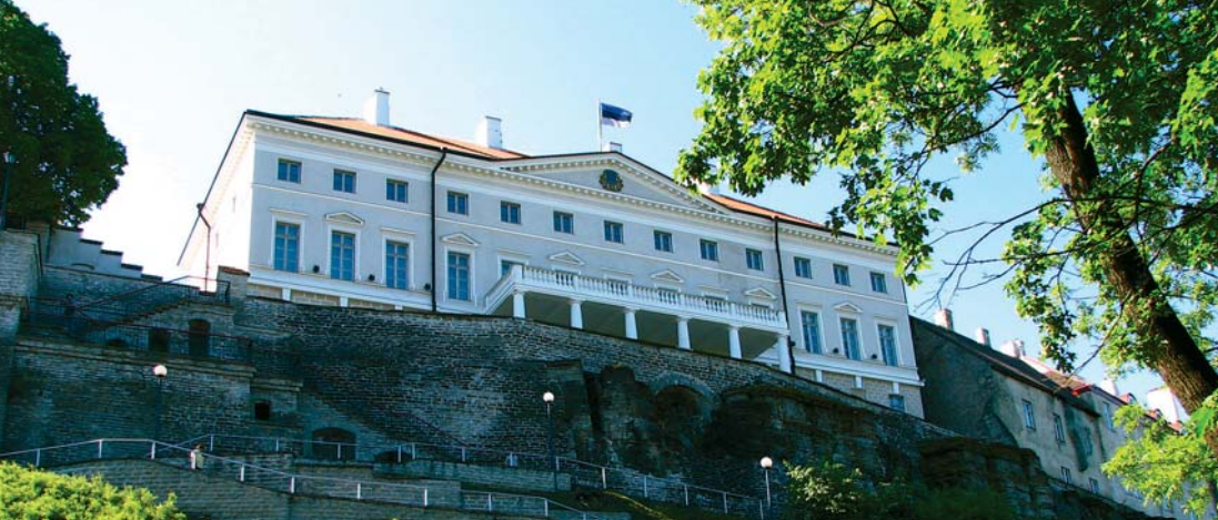
Eesti valitsuse residents Stenbocki maja