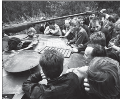
1991. aasta riigipöördekatse ajal Eestisse saadetud Nõukogude armee tank Tallinna lähistel Kloostrimetsas

Riigipöördekatse Moskvas 1991. aasta augustis tõi kaasa iseseisvuse lõpliku taastamise . Pihkvast Tallinna saadetud õhudesant-diviisi üksuste kohalolekule vaatamata otsustasid Eesti ülemnõukogu ja Eesti Kongress 20. augustil 1991 taastada Eesti iseseisvuse. Seda otsust tunnustasid kiiresti lääne-riigid ja Venemaa.