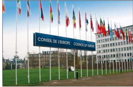
Euroopa Nõukogu hoone Strasbourgis

Eesti on Euroopa Nõukogu liige 14. maist 1993.