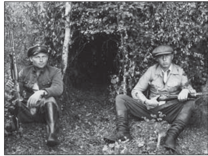
Metsavennad oma punkri ees

Maa oli kogu rahva omandiks kuulutatud juba 1940. aastal, kuid talumajapidamised jäid Eestis siis alles. Jõukamatele talupidajatele kehtestati kõrged riiginormid ja maksud. Alles 1949. aasta küüditamine hirmutas suurema osa talupidajatest kolhoosidesse , mis tõi kaasa põllumajanduse allakäigu. Maaelu hakkas jälle edenema kümnekonna aasta pärast. Teise maailmasõja järel jätkus Eestis