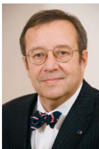
Vabariigi President Toomas Hendrik Ilves

Eesti riigi sõnum saab seetõttu olla ühene: me toetame iga siin elava mittekodaniku tahet saada Eesti kodakondsus ja liituda täielikult Eesti ühiskonnaga. See on privileeg, mis kuulub vaid Eesti Vabariigi kodanikule.