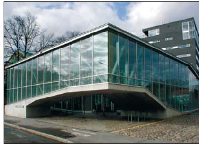
Okupatsioonide muuseumi ekspositsioon kajastab aastaid 1940–1991, mil Eestit okupeerisid vaheldumisi Nõukogude Liit ja Saksamaa

Septembris 1939 puhkes Teine maailmasõda. Juunis 1940 alistas Saksamaa Prantsusmaa. Samal ajal esitas Nõukogude Liit Balti riikidele ultimaatumid. Neis ähvardati sõjalise jõuga, nõuti täiendavate Nõukogude vägede lubamist riiki ning valitsuse vahetust. Balti riigid, millel polnud lootust saada välisabi, võtsid ultimaatumid vastu. 17. juunil 1940 okupeeris Punaarmee Eesti. Nõukogude Liidu esindajad määrasid ametisse uue valitsuse ja parlamendi, mis taotlesid Eesti liitmist Nõukogude Liiduga. Nõukogude Liidu ülemnõukogu arvas Eesti Nõukogude Liidu koosseisu 6. augustil 1940.