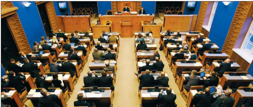
Riigikogu täiskogu istung

Kõik Riigikogu liikmed kuuluvad komisjonidesse . Riigikogu komisjon on töörühm, kus arutatakse ühe valdkonna piires esitatud seaduseelnõusid. Alalised komisjonid on näiteks väliskomisjon, kultuurikomisjon, rahanduskomisjon, keskkonnakomisjon jne. Iga komisjon arutab oma valdkonna probleeme ja seaduseelnõusid. Niimoodi saab parlamendi liikmete koor-