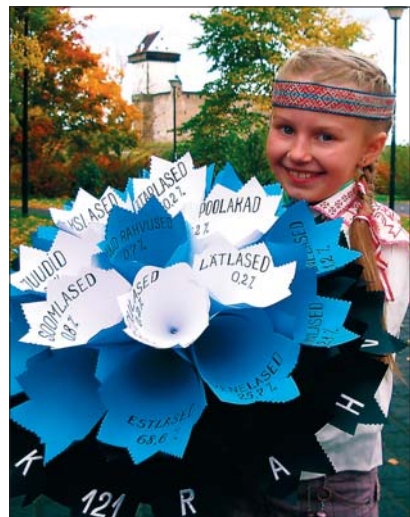
Töö fotokonkursilt „Üks riik – 121 rahvust“

Eesti kuulub rahvaarvu poolest maailma väiksemate riikide hulka.