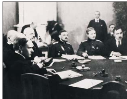
Rahuläbirääkimised Tartus 1920. aastal

2. veebruaril 1920 sõlmisid Eesti Vabariik ja Nõukogude Venemaa Tartu rahulepingu . Mõlemad riigid tunnustasid teineteise suveräänsust.