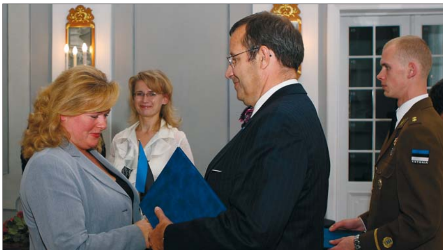
Kodakondsustunnistuste pidulik kätteandmine Kadrioru kunstimuuseumis 30. septembril 2008

Seejärel saadetakse dokumendid valitsusele, mis otsustab kodakondsuse andmise. Kui valitsuse otsus on positiivne, vormistatakse uuele kodanikule kodakondsustunnistus, mis antakse kätte pidulikul tseremoonial. Seejärel saab kodanik taotleda Eesti kodaniku passi ja isikutunnistust ehk ID-kaarti.