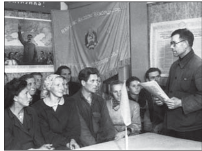
Kolhoosiesimees koosolekul kõnelemas

sõjaväes, kui ka suur hulk „Nõukogude-vastast elementi”. Jätkusid ka küüditamised : 1945. aastal viidi Siberisse mõnisada Eestisse jäänud sakslast, 1949. aastal küüditati üle 20 000 inimese, peamiselt talupojad, 1951. aasta alguses Jehoova tunnistajad.