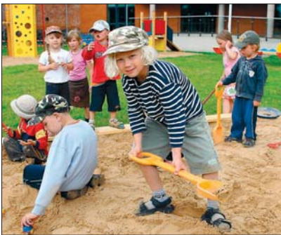
Kohalikud omavalitsused peavad üleval lasteaedu

Valla ja linna ülesanne on näiteks korraldada eakate inimeste hoolekan- net, veevarustust, prügimajandust, teede ja tänavate korrashoidu jne. Samuti peab kohalik omavalitsus üleval lasteaeda, kooli, raamatukogu ja rahvamaja.