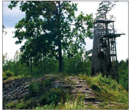
Varbola linnuse varemud koos piiramistorniga

Maaomanikud (mõisnikud) olid enamasti Saksamaalt tulnud ristirüütelite, sõjameeste, ametnike ja kaupmeeste järeltulijad. Koos Saksa päritolu linnakodanike ja vaimlikega moodustasid nad kohaliku ülemkihi, keda nimetati baltisakslasteks. Neile kuulus kohalik võim ja kohalik ametlik keel oli saksa keel.