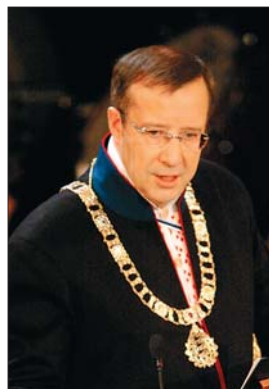
Toomas Hendrik Ilves

Pärast Eesti iseseisvuse taastamist on Eesti presidendid olnud aastail 1992–2001 Lennart Meri ja aastail 2001–2006 Arnold Rüütel. Alates 2006. aastast on Eesti president Toomas Hendrik Ilves.