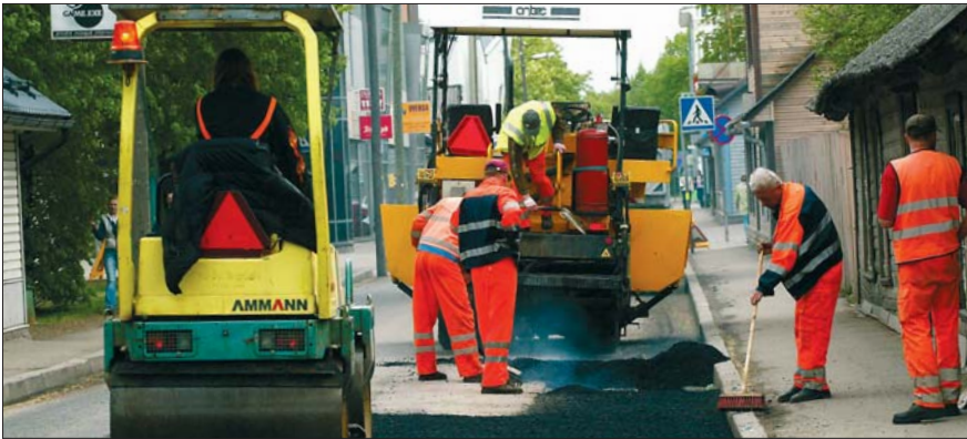
Teede korrashoid on kohaliku omavalitsuse ülesanne

Kohalikul omavalitsusel on oma ülesannete täitmiseks iseseisev eelarve . Eelarveraha saadakse üksikisiku tulumaksust ja maamaksust, samuti riigi-eelarvest. Valla- või linnavolikogu võib kehtestada ka kohalikke makse .