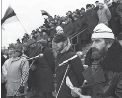
Rahvarinde poolt korraldatud miiting Linnahalli juures 1988

Nõukogude Liidu väetisetööstuse ministeerium kavandas Lääne-Virumaale suurt fosforiidikaevandust. See oleks ohustanud keskkonda ja eeldanud töötajate sissetoomist Nõukogude Liidust. Avalik vastuseis sundis võime plaanist loobuma.