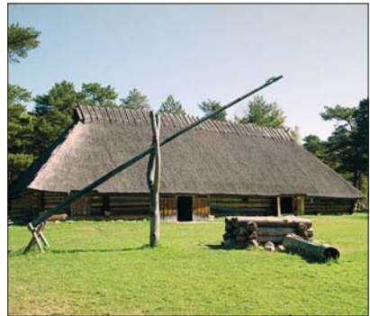
Eestlaste traditsiooniline elumaja – rehelamu