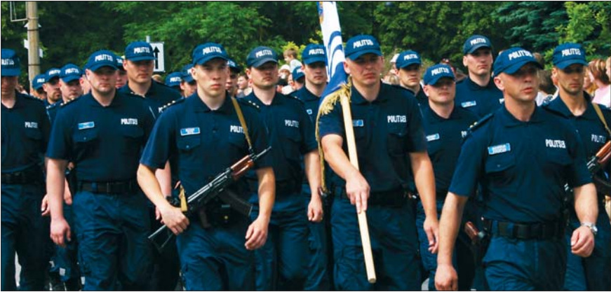
Õigus töötada politseinikuna on ainult Eesti kodanikul

Eesti riik kaitseb oma kodanike õigusi välisriikides . Eesti saatkond aitab Eestisse tagasi pöörduda kodanikul, kes on välismaal reisisid või elades hätta sattunud. Vajaduse korral aitab saatkond vormistada uue reisidokumendi, hankida kojusõidu piletit, korraldada arstiabi jne.