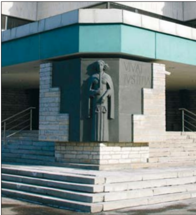
Harju maakohtu Liivalaia kohtumaja

Kohus on Eestis ainus organ, mis mõistab õigust. See tähendab, et lõplikult otsustab kõik vaidlusküsimused kohus. Kohtus on võimalik vaidlustada ka ametniku otsus. Kõigil juhtudel, kui inimese õigusi on rikutud, saab lõpliku otsuse tüliküsimuses langetada kohus.