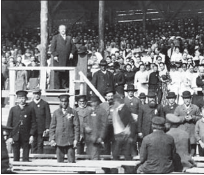
Laulupidu Tartus 19. sajandil

1890. aastaid nimetatakse Eesti ajaloos venestamise ajaks . Balti kubermangudes kehtestati Vene kohtusüsteem ja linnaseadused. Maapiirkondades säilis baltisaksa mõisnike võimküll Esimese maailmasõjani. Asjaajamise keeleks sai siiski vene keel ning venekeelseks muudeti ka haridus algkoolist ülikoolini.