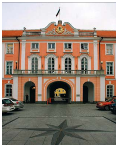
Riigikogu kogunemispaiik – Toompea loss

14. septembril 2003 korraldati Eestis rahvahääletus, millega otsustati Eesti ühinemine Euroopa Liiduga. Põhiseaduse sellekohase täiendamise poolt oli 66,83 protsenti hääletanud inimestest.