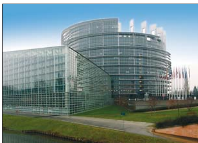
Euroopa Parlamendi hoone Strasbourgis

Euroopa Parlamenti valitakse saadikud igast riigist riigi elanike arvu alusel. Euroopa Parlamendi valimised toimuvad iga viie aasta tagant. Parlamendi