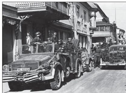
Saksa vägede sisenemine Pärnusse 1941

1941. aasta 22. juunil puhkes sõda Saksamaa ja Nõukogude Liidu vahel. Saksa armee jõudis juuli alguses Eestisse. Eestis oodati sakslaste saabumist, et pääseda bolševike terrori alt. Lisaks lootsid paljud, et sakslased toetavad Eesti iseseisvuse taastamist. Tuhanded mehed võitlesid selle nimel metsavendadena või astusid Saksa sõjaväkke. Sakslased Eesti riigi iseseisvust ei taastanud. Algasid natslikud repressioonid. Eestis hukati 8000 inimest, nende hulgas umbes tuhat Eesti juuti ja tuhat Eesti venelast. Mitu tuhat inimest saadeti