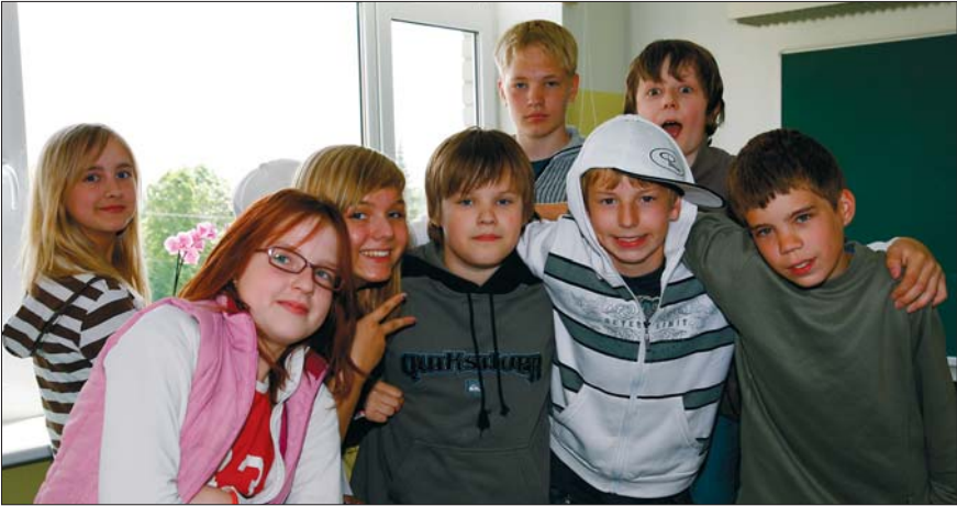
Kõigil on õigus ja kohustus haridusele

omavalitsusi võivad ajaloolisest traditsioonist lähtudes moodustada saksa, vene, rootsi ja juudi vähemusrahvusest isikud. Lisaks nendest vähemusrahvustest isikud, kelle arv Eestis on üle 3000. Tänapäevaks on oma kultuuriautonomia õiguse teostanud soomlased ja rootslased. Riigilt on toetust saanud ka Peipsi ääres elavad vanausulised. Eestis töötab 18 eri rahvaste pühapäevakooli ning rohkem kui 200 kultuuriseltsi. Vähemusrahvuse kultuuriomavalitsuse põhieesmärgid on korraldada emakeele õpet ja kultuuriüritusi, moodustada rahvuslikke kultuuriasutusi jne.