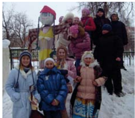
Maslenitsa pidustused Ozertsja külas.

Maslenitsa paneb inimesed kogu hingest lõbutsema, tavaks on korraldada rahvarohkeid pidustusi, mille juurde kuuluvad rahvamuusika ja tantsud. Sel päeval panevad peolised kindlasti selga rahvarõivad.