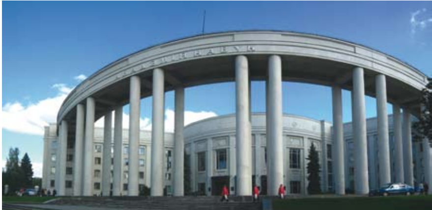
Valgevene Riikliku Teaduste Akadeemia peakorpus Minskis.

Teaduskeskused tegelevad mitmete riiklikku tähtsust omavate valdkondadega: olgu siinkohal nimetatud maavarade töötlemine, energeetika, info- tehnoloogia, keskkonnaseire, kosmosetehnoloogia, meditsiin.