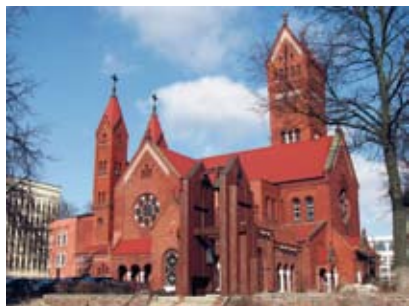
Püha Simeoni ja Helena kirik.