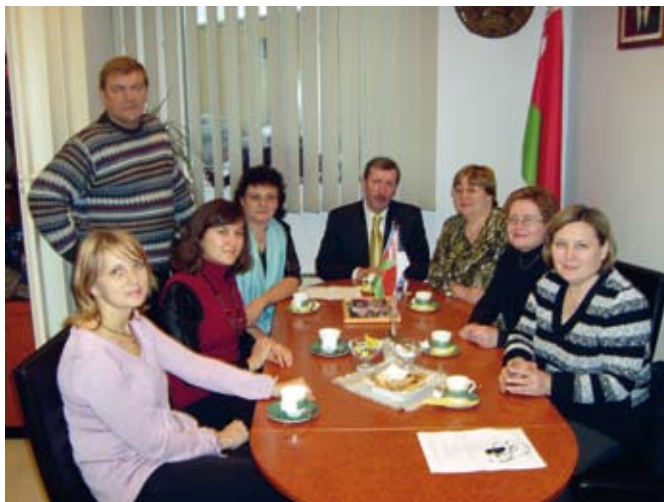
Eesti ja Valgevene õpetajad kohtumisel Valgevene Peakonsulaadis 2008. aastal.