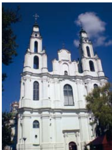
Sofia katedraal ...