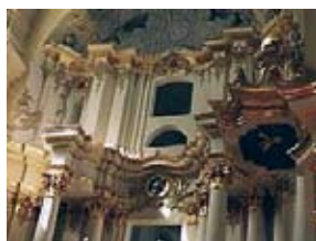
... ja selle sisevaade.