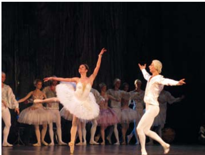
Ballett „Pähkklipureja” Valgevene Riikliku Akadeemilise Suure Ooperi- ja Balletiteatri laval.

Tänases Valgevenes korraldatakse suurejoonelisi teatrifestivale, millest mainekamad on Minskis toimuv „Panorama” ja Brestis aset leidev „Belaja Veža”. Samasse ritta kuulub mitu lavakunstikonkurssi. Gomelis toimuv festival „Slaavi teatrite kohtumised” on regionaalsest teatrisündmusest ammu üle kasvanud rahvusvaheliseks. Lühietendusi kantakse ette Maladzetšnas „Maladzetšnenskaja sakavitša” festivalil. Minskis korraldatakse regulaarselt nukuteatrite festivali, samuti saab pealinnas ülevaate monoetendustest. Valgevene teatrid on toonud auhindu ka prestiižikatelt rahvusvahelistelt festivalidelt: Edinburgh`i festivalilt Suurbritannias, Shakespeare`i-nimeliselt festivalilt Hispaanias, Tšehhovi-nimeliselt festivalilt Venemaal ja mujalt.