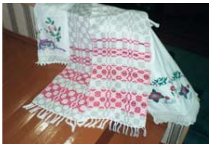
Rahvusliku ornamendiga kaunistatud rušnik.

Muistne kunstiliik on ka tikand. Tikkimiseks kasutati linast, villast või siidniiti. Tikandiga kaunistati nii riideid, peakatteid kui ka jalanõusid ning mitmesuguseid teisi esemeid. Nahast jalanõudele tikiti tavaliselt punase, sinise, roheline ja kollase niidiga. Kullakarva niiti ja samuti siidniiti kasutati enamasti kraede, mansettide ja peakatete kaunistamiseks. Levinuim muster oli valgele põhjale tikitud puna-must ornament.