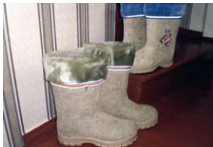
Kuulsad Valgevene vildid.