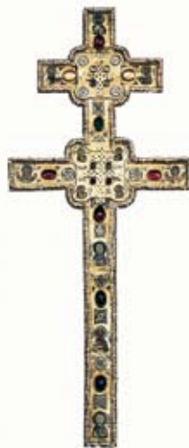
Püha Eufraasinnja rist.

Enamik usklikest valgevenelastest on kristlased: õigeusklikud, katoliiklased, uniaadid ja protestandid. Uniaadi kirik ühendab endas nii katoliiklikke kui ka õigeusu traditsioone ja on seega täiesti omalaadne nähtus. Õigeusk levis Valgevene territooriumile X sajandil: esimene, Polatski piiskopkond loodi 992. aastal. Katoliiklusest võib sealmail kõnelda XIV sajandi lõpust. Protestantluse, luterluse ja kalvinismi algusaastad on XVI sajandis. Jудаismi järgijaid elas sealmail juba IX–XIII sajandil. Islam levis Valgevenes XIV–XVI sajandil.