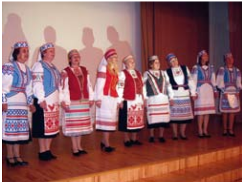
Näiteid naiste rikkalikust rahvarõivakollektsioonist.

Valgevene traditsioonilised rahvarõivad on säravad ja originaalsed. Sajandite vältel on naised oma rahvuskostüüme luues ja rikastades pannud neisse rohkesti tööd, kaunidust ja hinge. Kristlastest valgevenelaste rõivad vastasid kogu neid ümbritsevale ilule, mida ülistasid meloodilised rahvalaulud ja ammustest aegadest pärinevad tantsud. Huvitav ja omapärane on see, et vanasti kanti ikka valgeid riideid, olgu siis tegu pulma või