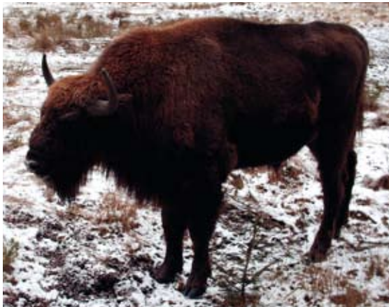
Uhke piison (zubr) – Belaveži puštša ja ka Valgevene sümbol.