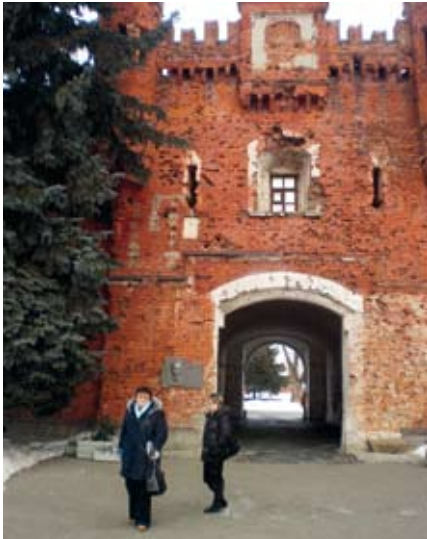
Bresti kindluse väravad.

Bresti oblastist on teada Kamjanetsi torn Belaja Veža (XIII sajand), barokki esindav Karal Baramei kirik Pinskis (XVIII sajand), hilise baroki näide, Pinskis asuv Butrõmovitši loss (1784–1790). Põnevad ehitised on Ružanõ asula paleekompleks (XVII–XVIII sajand) ja klassitsismi elementidega Kossava loss (XIX sajand).