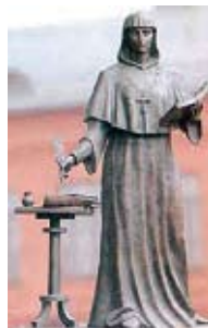
Mälestussammas Eufrašinnja Polatskajale Valgevene Riikliku Ülikooli juures.

12-aastaselt pühitseti ta nunnaks ja kogu oma elu elas ta vaeseid aidates ning kirikute ja kloostrite ehitamisel kaasa lüües. Ta oli esimene naine, kellele vene õigeusu kirik omistas pühaku staatuse. Austusväärne naine ülistas inimeste hingepuhtust ja siirast armastust, kutsus kõiki elama rahu ja harmoonias. Valgustustegevust alustas püha Eufrašinnja raamatute ümberkirjutajana. Ta suri palverännakul Jeruusalemmas.