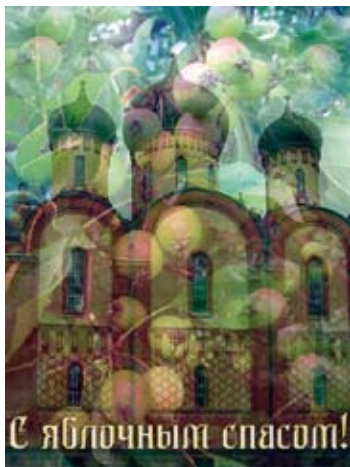
Head Jablotšnõi Spas'i püha!

Seda püha tähistatakse 19. augustil. Nime- tus on tulnud saagijumal Spasi nimest. Alg- selt peeti mitmeid Spasiga seotud püha- sid: näiteks seene-, leiva-, marjapüha. Neist tuntumad olid kolm püha: Mee Spas, Pähkli Spas ja kõige tähtsam – Õuna Spas ( Jablotšnõi Spas ).